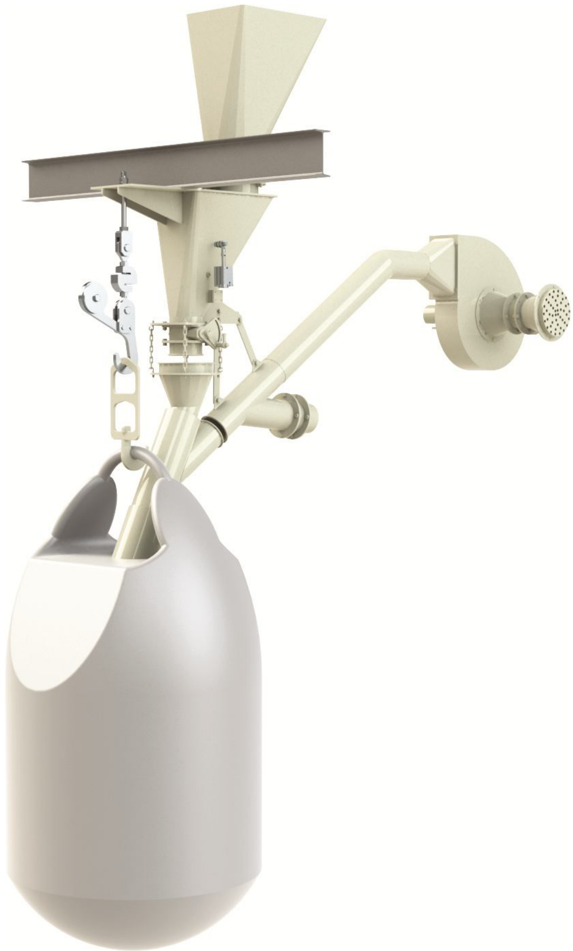
Рис.2. Общий вид дозатора.