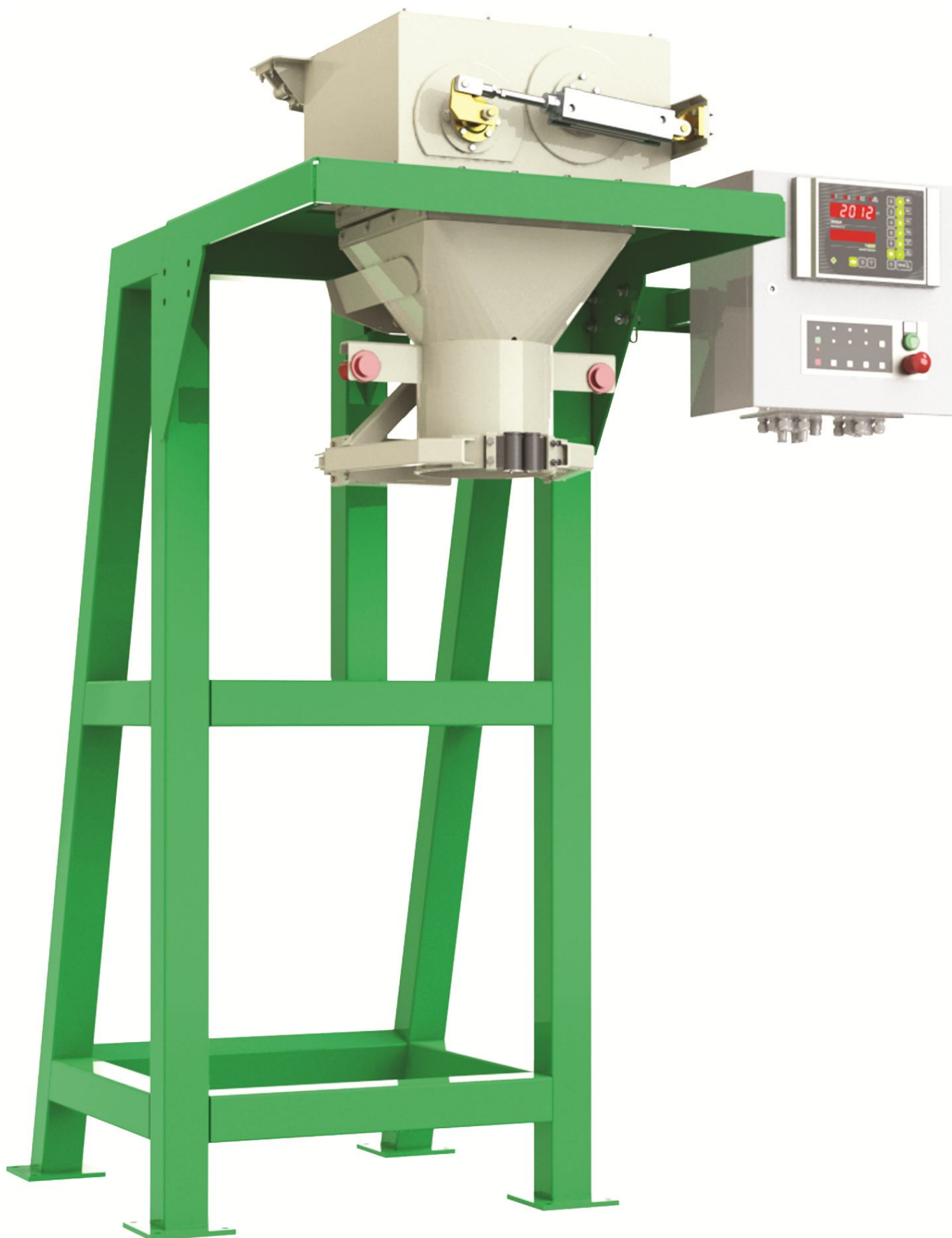
Рис.2. Общий вид дозатора.